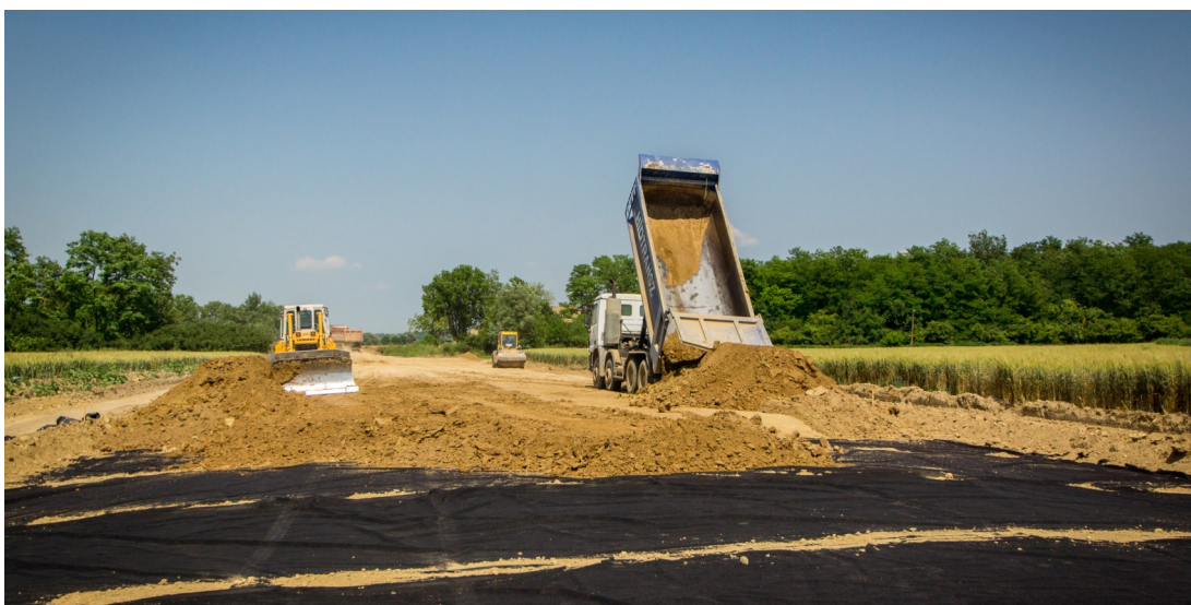
Tiptex nemszőtt geotextília beépítése töltéstalpra elválasztásra és szűrésre

A Tiptex termékcsalád különböző mechanikai tulajdonságokkal rendelkező tűnemezelt és hőkezelt geotextíliákat tartalmaz, amelyek a legmagasabb szintű mérnöki teljesítményt és minőségi színvonalat nyújtják. A hasonló súlyú tűnemezelt, nem szőtt geotextíliákhoz képest jóval nagyobb átszűrődással szembeni ellenállással rendelkező termékeket foglal magában.